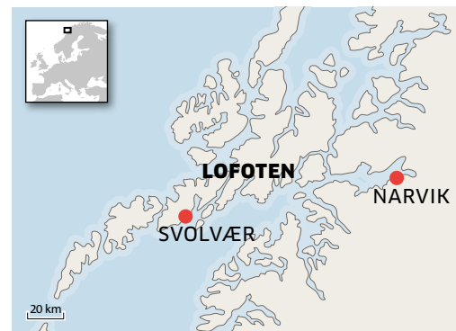
Illustration: KEN NISS

Trots de många timmarna på sadeln och att solen får havsytan att glittra förföriskt, vilket bidrar till en nästan oemotståndlig lust att rusa ner och slänga sig i, är förutsättningarna i övrigt inte de bästa. Vindarna som drar in är allt annat än varma och vattnet är iskallt. Så att bada får vänta. I alla fall till nästa gång.