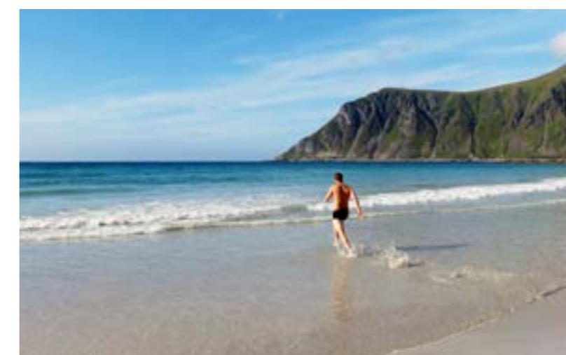
BADLÅGE. På de mer västliga öarna finns stränder med vit finkornig sand.

SOM I EN SAGA. Lofoten är med sina 1 226 kvadratkilometer och drygt 24 000 personer något mindre än Öland till både yta och folkmängd.