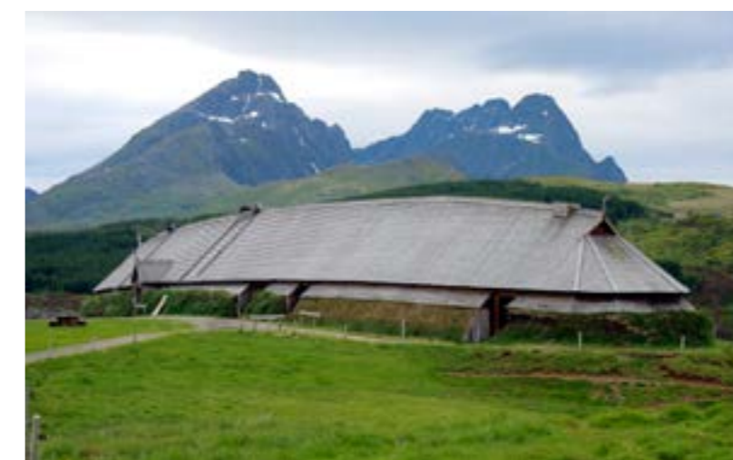
KOPIA. Vikingamuseet Lofotr har byggts som en kopia av världens längsta byggnad från vikingatiden. 83 meter är långhuset.