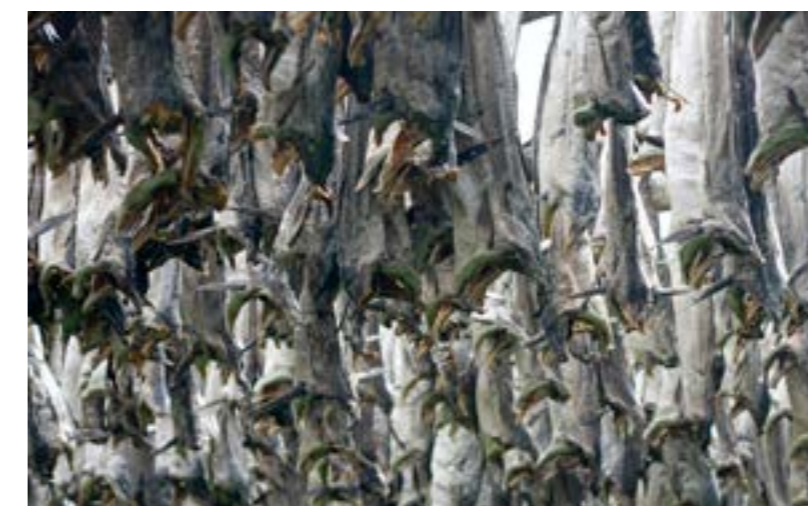
PÅ TORK. Torrffisken självtorkar av sol och vind under cirka tre månader.