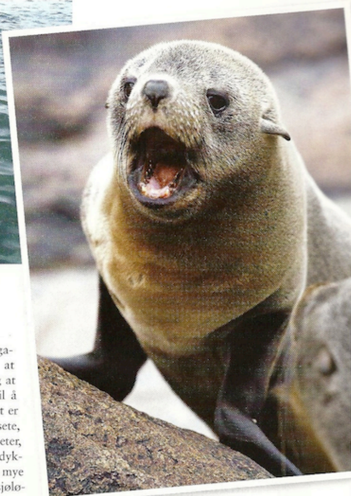
SJØLØVEØYA: Isla de los Lobos, beliggende ti kilometer utenfor Puntas kyst, har verdens nest største sjøløvebestand og er det perfekte sted for dykkerutflykter.

Vi i den lille gruppen har vært nedi en stund, og det er på tide å komme seg opp til overflaten igjen når dykket plutselig tar en uventet og ubehagelig vending. Frem til nå har sjøløvene enten ignorert oss eller virket nysgjerrige, men likevel holdt litt avstand. Nå er det plutselig en stor sjøløvehann et titalls meter foran oss. Den beveger seg sakte mot meg og ser svært truende ut. Jeg snur meg raskt rundt og ser etter de andre i gruppen. De er et lite stykke lengre borte, og det virker ikke som om de har oppfattet det som skjer. Sjøløvehannen har kommet enda nærmere, og det hele begyn-