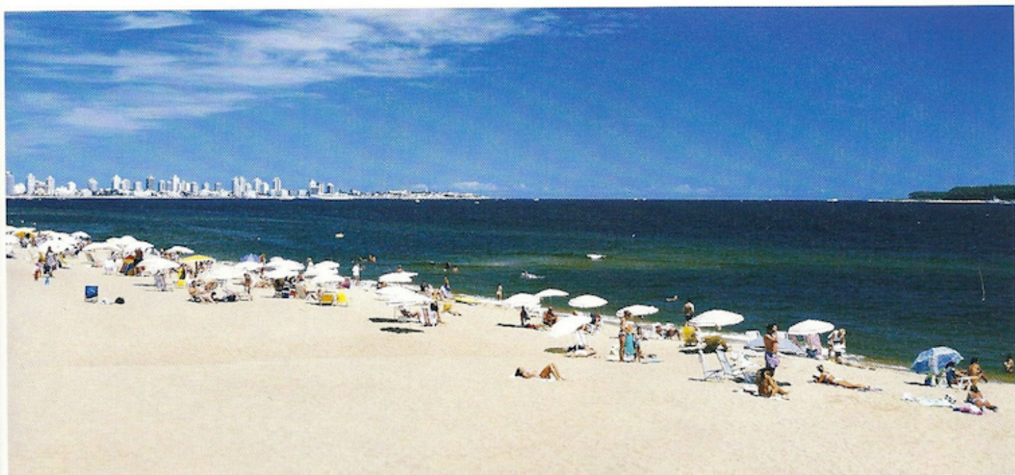
CELEBERT FERIESTED: Punta del Este, Latin-Amerikas svar på både Saint-Tropez og Monte Carlo, er en eneste stor catwalk for kjendiser fra hele verden.

Odden hvor Punta ligger i dag ble "oppdaget" i 1516 av spanjolene under Juan Días de Solís' ledelse, og fikk navnet Cabo de Santa Maria (Hellige Maria-odden). Siden skjedde det ikke så mye i de neste århundrene, men på 1800-tallet tok flere små fiskelandsbyer form i området, som ble omdøpt til Villa Ituzaingó. I 1907 byttet det igjen navn, og denne gangen til det nåværende Punta del Este, og allerede samme år kom de første turistene hit. Det var familier fra Argentina og Uruguays hovedstad Montevideo som ble bedt hit av Punta del Estes Badeselskap.