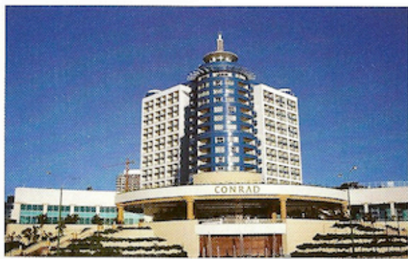
77-HOTELLET: Hotel Conrad regnes som et av Sør-Amerikas fremste hoteller, og huser dessuten Uruguays eneste private kasino.

Prisen for å komme inn øker i takt med at sesongen når toppen. Da må du regne med å betale 300 – 600 kroner i inngangspenger. Men har du uflaks, hjelper det ikke med tykk lommebok. De mest populære kveldene må du også være "noen" for å komme inn.