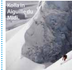
Kolla in Aiguille du Midi.

Pris Genève-Chamonix från cirka 370 kr t/r. Alpybus har låga priser.