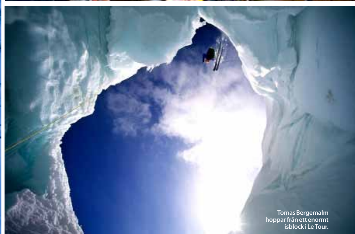
Tomas Bergemalm hoppar från ett enormt isblock i Le Tour.