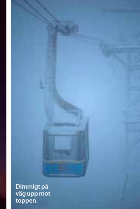
Dimmigt på väg upp mot toppen.