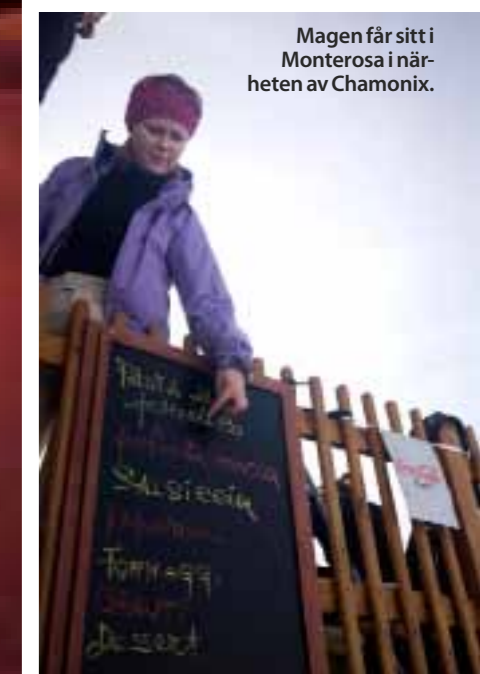
Magen får sitt i Monterosa i närheten av Chamonix.